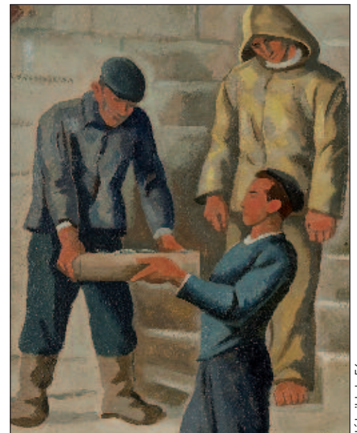
détail lot 56

SARL au capital de 10 000 € - RCS Bayonne 791 314 784 TVA FR 23 791314784 - Agrément 032-2013