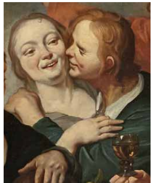
Détail du lot 82