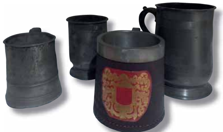
140 QUATRE CHOPES en étain. 80 / 120 €