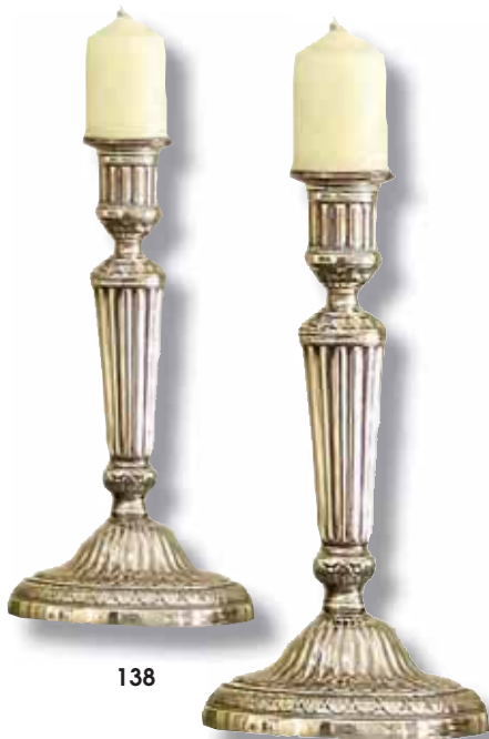
138 PAIRE DE FLAMBEAUX en métal argenté, fût cannelé, base à godrons et palmettes. Style Louis XVI. Haut. 27,5 cm Pair of silver plated flambeaux in the Louis XVI style. 150 / 200 €